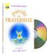
CD, Vidéo, Livre CD