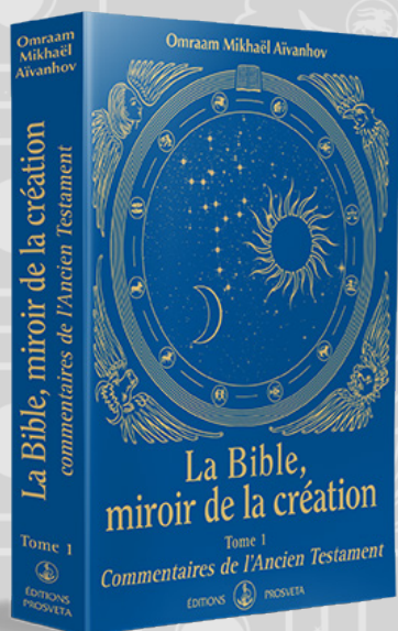
Tome 1 Commentaires de l'Ancien Testament