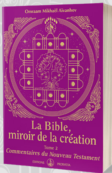
Tome 2 Commentaires du Nouveau Testament