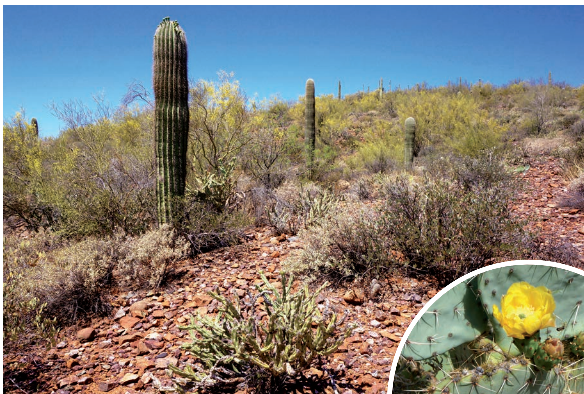
Cactus Saguaro, originaire du désert de Sonora – La fleur du saguaro est l'emblème de l'Arizona (États-Unis)

« Habituez-vous aussi à parler aux plantes et aux graines quand vous les mettez en terre. Dites-leur quelques mots pour les encourager à croître, à fleurir... Est-ce que vous savez qu'il existe des plantes à qui vous pouvez demander de vous protéger? Les cactus, par exemple. Certains sont pourvus de grandes pointes acérées, et si vous en avez auprès de vous, demandez-leur de vous protéger des courants nocifs, malsains, qui circulent dans l'atmosphère: avant de vous atteindre, ces courants seront désagrégés. »