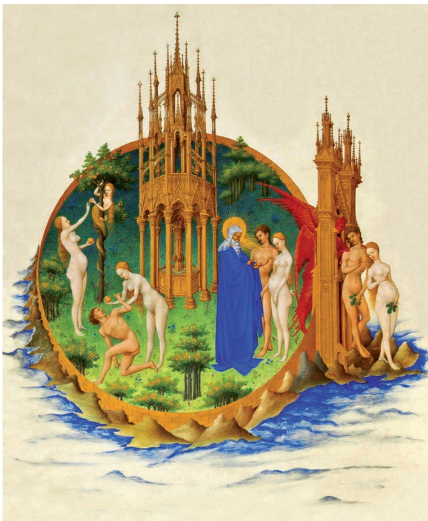
Le jardin d'Éden, dans « Les très riches Heures du Duc de Berry »