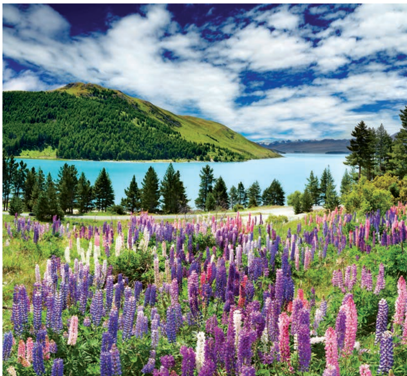
Le lac Tekapo, Nouvelle Zélande – Photo : Muha04/iStock

Des êtres vivants avec lesquels on peut entrer en relation... Oui, une fleur n'est pas seulement une parcelle de matière colorée et parfumée, elle est la demeure d'une entité qui vient nous parler de la terre et du Ciel. Et si on sait comment la regarder, comment se lier à elle, on entre en contact avec les forces de la Nature, avec les entités qui travaillent à faire d'elle cette présence tellement vivifiante et poétique. »