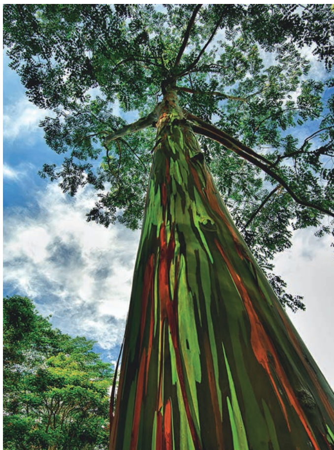
Eucalyptus Arc-en-Ciel, île de Kauai (Hawaii)

L'amour le plus spirituel reçoit son élan de la force sexuelle, mais nous devons apprendre comment le cultiver, l'arroser, le protéger des insectes et des orages. Celui qui goûte les fruits de cet arbre Amour, connaît la saveur de l'immortalité et de la vie éternelle. »