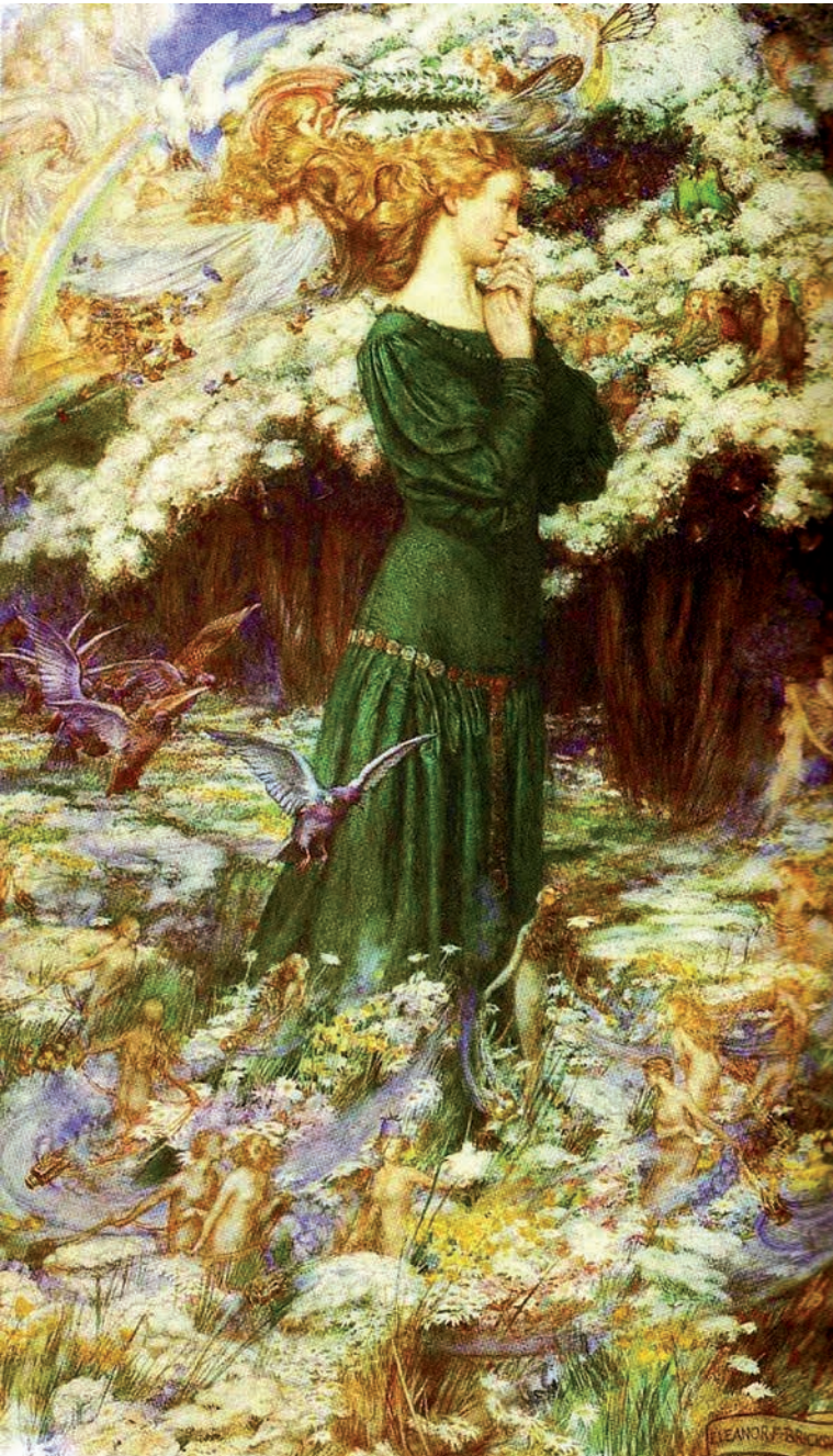
Le monde de l'aimante, Eleanor Fortescue-Brickdale (1905)

Alors, sur le chemin que vous parcourez, ayez un sentiment d'amour et de reconnaissance envers le ciel, les arbres, les fleurs, les cailloux, la terre... Pensez aussi à tous ces êtres invisibles qui nous entourent. C'est grâce à eux que la nature est vivante et qu'elle nous offre tout ce qu'elle possède. Adressez-vous à eux, et dites-leur : « Ô vous, gentils enfants de la terre, de l'eau, de l'air et du feu... vous, gnomes, ondines, sylphes, salamandres, je vous aime, soyez remerciés et bénis pour votre travail. »