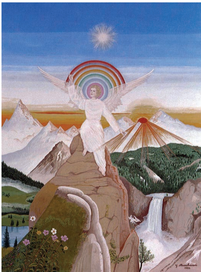
L'ange du levant,

ou dans la façon dont l'être humain lui-même est construit. »