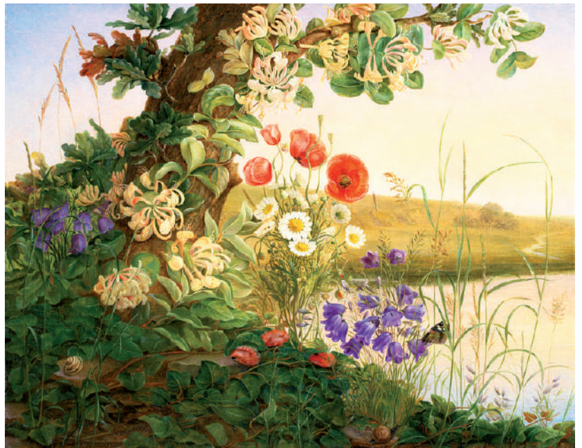
Berge fleurie, Christine Løvmand (1841)

Parce que, regardez, qu’est-ce qu’une fleur ? Elle ne sait ni chanter, ni danser, ni jouer du violon, et pourtant même les danseurs, les chanteurs, les musiciens s’extasient devant elle... Et alors, si nous savons être comme des fleurs, pourquoi les divinités qui sont tellement au-dessus de nous ne viendraient-elles pas s’extasier ? Elles diront : « Oh ! quelle gentille fleur ! » Et elles s’occuperont de nous pour nous rendre encore plus purs, plus lumineux et plus parfumés. »