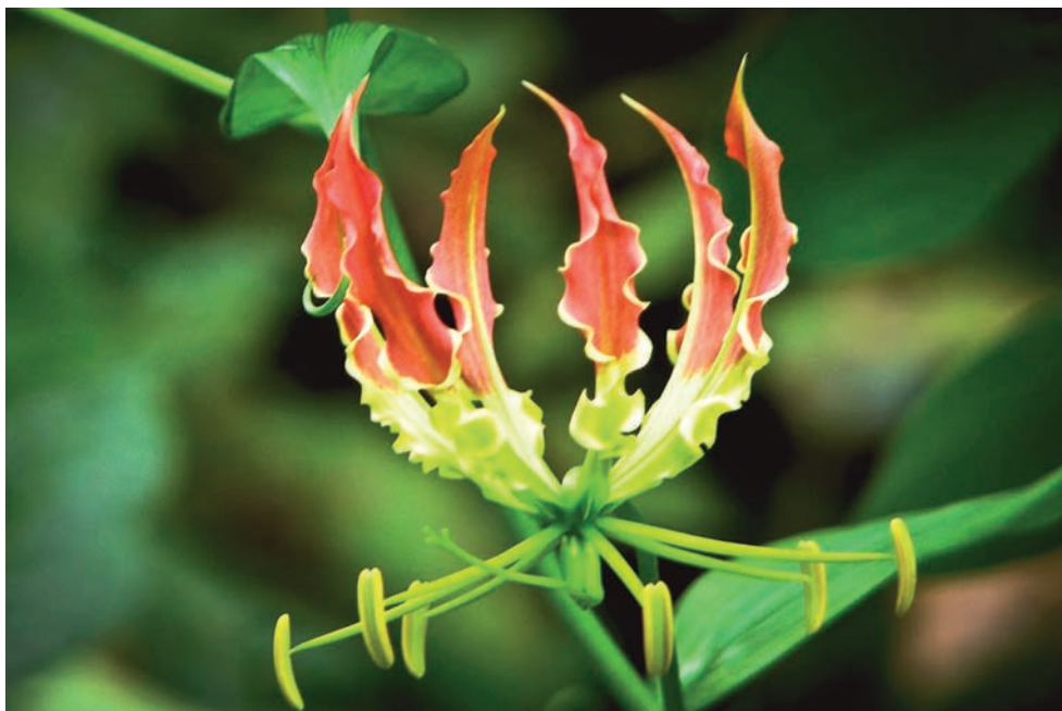
Lis de feu (Gloriosa Superba), originaire des régions tropicales d'Asie et d'Afrique (fleur nationale du Zimbabwe)

Une fleur, par exemple, est le vêtement dans lequel s'habille une entité. C'est pourquoi il faut méditer sur les fleurs, leurs formes, leurs couleurs, leurs parfums, pour connaître la nature des êtres qui possèdent de tels vêtements ; et méditer non seulement sur les fleurs, mais sur tout ce qui existe dans les différents règnes de la nature : minéral, végétal, animal, humain. Un cristal, un diamant, une pierre précieuse est le vêtement, le corps dans lequel une entité spirituelle s'est incarnée afin de se manifester... »